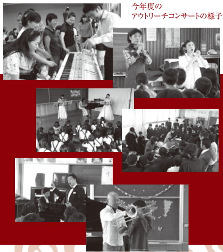
今年度の アウトリーチコンサートの様子