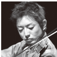
高木 和弘 (ヴァイオリン)